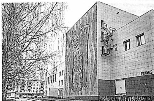
Панно «Энергия» украшает ДК «Энергетик».