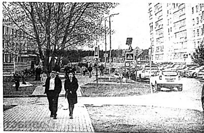
Улица Аделя Кутуя.