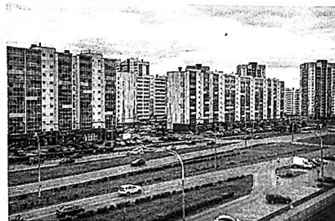
Улица Нур Баян находится в микрорайоне Замелекесье.