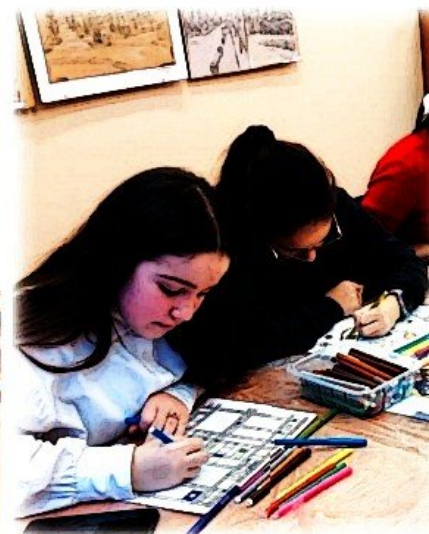
Работаем в стиле Мондриана: геометрическая абстракция