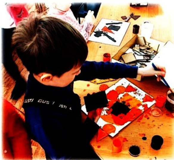
Осваиваем стиль Малевича: геометрические композиции

Оказалось, что это очень сложно сделать взрослому человеку. Как известно, сам Миро писал свои работы в состоянии, напоминающем транс. Линии, нарисованные мной для примера, никогда не напоминают стиль Миро, а вот дети-первоклассники, не владеющие ещё в полной мере плавным движением рук, срисовывая с образцов, воплощают мою задумку на ура.