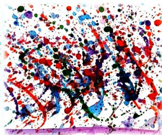
Работы в стиле Поллока: абстрактный экспрессионизм