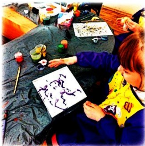
Работа со спин-артом в стиле Поллока