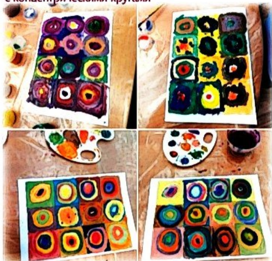
Работы в стиле Кандинского: квадраты с concentрическими кругами