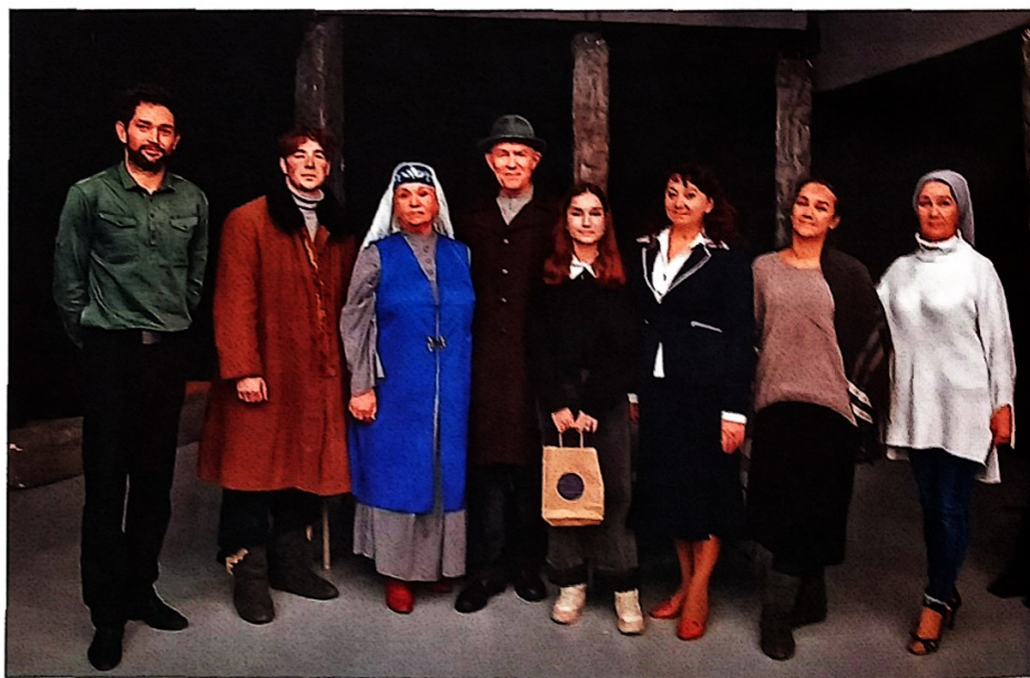
Фотолар А. Гыйләҗев исемендәге Чаллы татар дәүләт драма театрының матбуғат үзәгендә алынган.