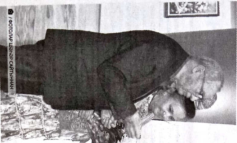
ФОТОЛАР ШӘһР СҮЙГҖННӘН