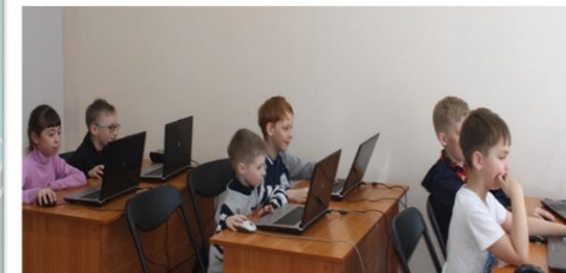
Курсы по созданию электронных презентаций