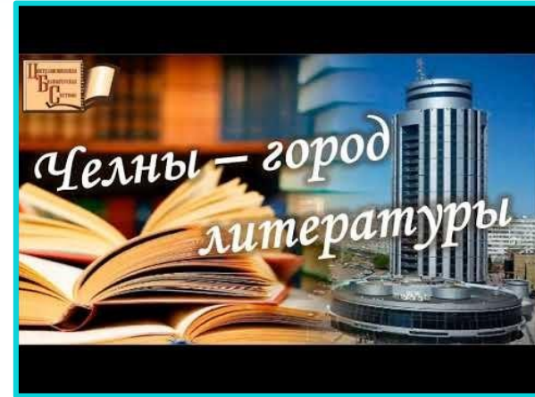
Литературная карта города