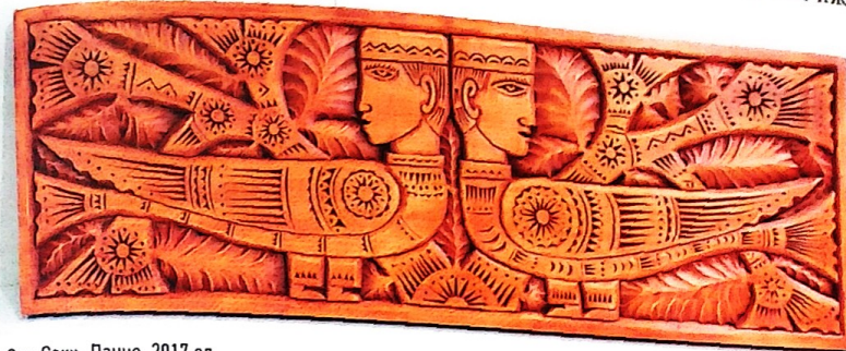
«Сак-Сок». Панно. 2017 ел

Хәмит Латыйфның ағач уймалары, яғни ағачны уеп ясаган сәнгате – меңбеллыктар буенча безне әйләндереп алган, тибрәтеп йоклаткан, йә кояшлы йорт, йә алтын бишек булып назлаган, йә тәгәрмәчле арба сыйфатында, йә уенчык ат булып донъя гиздергән; яфраклары, бизәкләре, хуш исләре, сайрар кошларының чыңгылдавы белән йөрәкләрне эңилкендергән урман