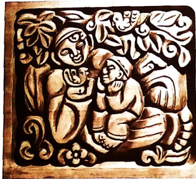
«Абый белән». Панно. 1977 ел

2000-2002 елларда Хәмит Латыйф «Туран» милли-мәдәни фондында эшли. Бу чорда кыска гына вакыт эчендә гажәп үзгә, функциональ яктан күптөрле ихтияжларга туры килгән күләмлә «уйма» серия пәйда була. Бу – агачтан ясалган сурәтлә яссы тәлинкәләр, зур-зур декоратив сандыклар, ипи савытлары, интерьер жисемнәре, ярма