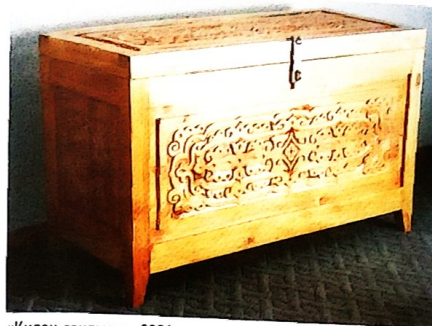
«Килән сандыгы». 2001 ел