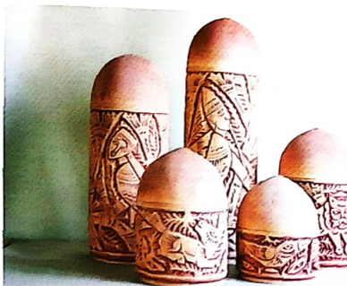
«Болгар урманында». Капкачлы агач вазалар