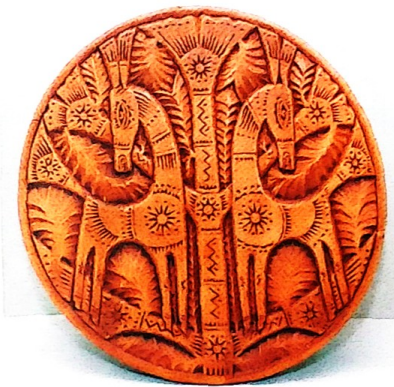
«Яз». Тәлинкә. 2015 ел