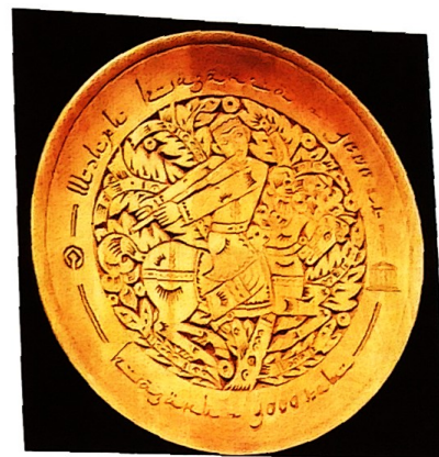
«Безнең көй». Тәлинкә. 2005 ел