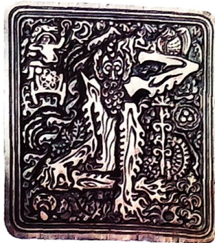
«Шүрәлә». Агач. 1975 ел

салыр өчен көпшәләр, декоратив паннолар. Аларның йөрәге – тыгыз тутырылган гөл-яфрак, чәчәк орнаменты, аларны «кочып», тирәләп алган кеше сурәте: «Кубыз көе», «Урман көе», «Тукай», «Сакчы кошлар», «Матур кыз», «Гармунчы»... Шәймәрдан чорында* (2002-2003) бу жанлы катлам – кошлар, күбәләкләр, хайванат – кояш-йолдыз, агар сулар, «тереклек агачы» сыман космогоник образлар белән керешеп китә... Останың агачны чокып, кисеп кенә, бизәкне өскә якты яссылык белән астагы батынкы шәүләләрен берләшүенән туган тирәлектән гайре, өтергене тибрәтеп, биетеп, фактуралы бай мохит кабызу ысулы туып чыга.