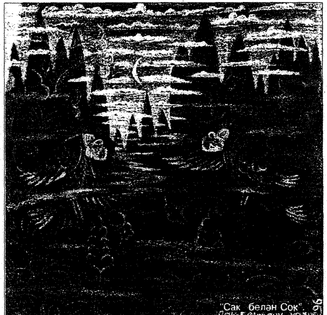
"Сак белән Сок"

Аның картиналары да ничектер күнелгә үтә дә якын. Аларда төркилек тә, мөселманлык та, шәрәкылек тә ярылып ята. Әмма ин элек барыбер татарча алар. Чын