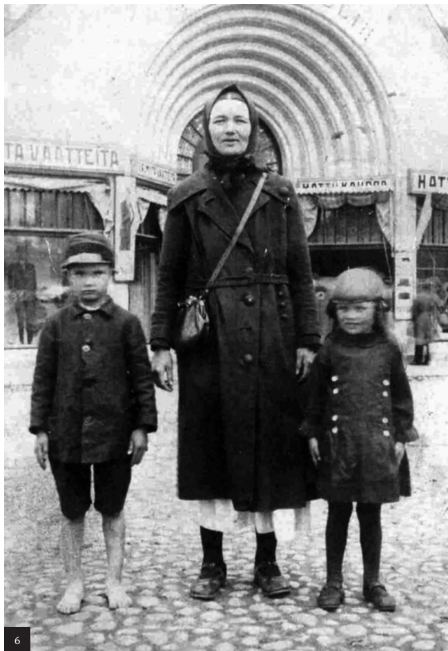
4 Центр г.Котка. 1930 год Котка шәһәре үзәге. 1930 ел