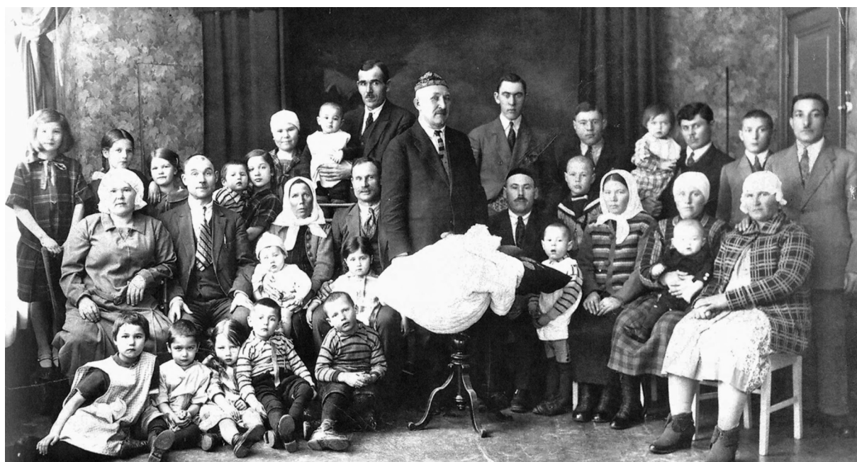
Праздник имянаречения в Куопио. 1926 год.

Куопиода балага исем кушу бэйрәме. 1926 ел.