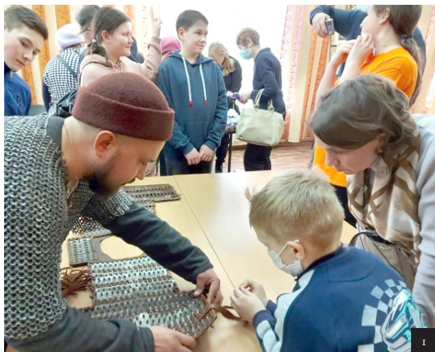
I Участники реконструкции военно-исторического клуба «Курултай» погрузили гостей праздника в атмосферу средневекового Волжско-Камского региона «Корылтай» хәреби-тарихи клубының реконструкцияләүдә катнашучылары бәйрәм кунакларын урта гасырлар Идел-Кама төбәге мохитенә кертте 2-6 МАСТЕР-КЛАССЫ ДЛҮА УЧАСТНИКОВ ЭТНОФЕСТИВАЛЯ ЭТНОФЕСТИВАЛЬДӘ КАТНАШУЧЫЛАР ӨЧЕН МАСТЕР-КЛАССЛАР

семейное мероприятие, на котором все перемещались по организованному площадкам.