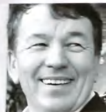
Владимир СОЛОВЬЕВ, министр культуры и туризма Удмуртской Республики