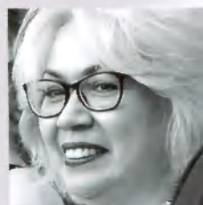
Эльвира КАМАЛОВА, первый заместитель министра культуры Республики Татарстан