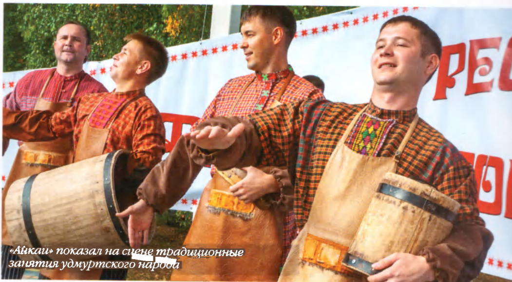
«Айкай» показал на сцене традиционные занятия удмуртского народа

из столицы Мордовии — Саранска. — Мы хотим представить вам настоящую аутентичную музыку наших двух народов — эрзя и мокша, — продолжил со сцены Николаев. Песня за песней, и вот уже пятеро мужчин в белых одеждах погрузили зрителей в богатый мир эрзя и мокши, в котором также встречаются женятся, растят детей, радуются весне, солнцу — Случилась такая история: мылась девушка в бане, а парень стал в окошко подглядывать — рассказывал Николаев. — И по старинному обычаю ему пришлось на ней жениться. Вот так