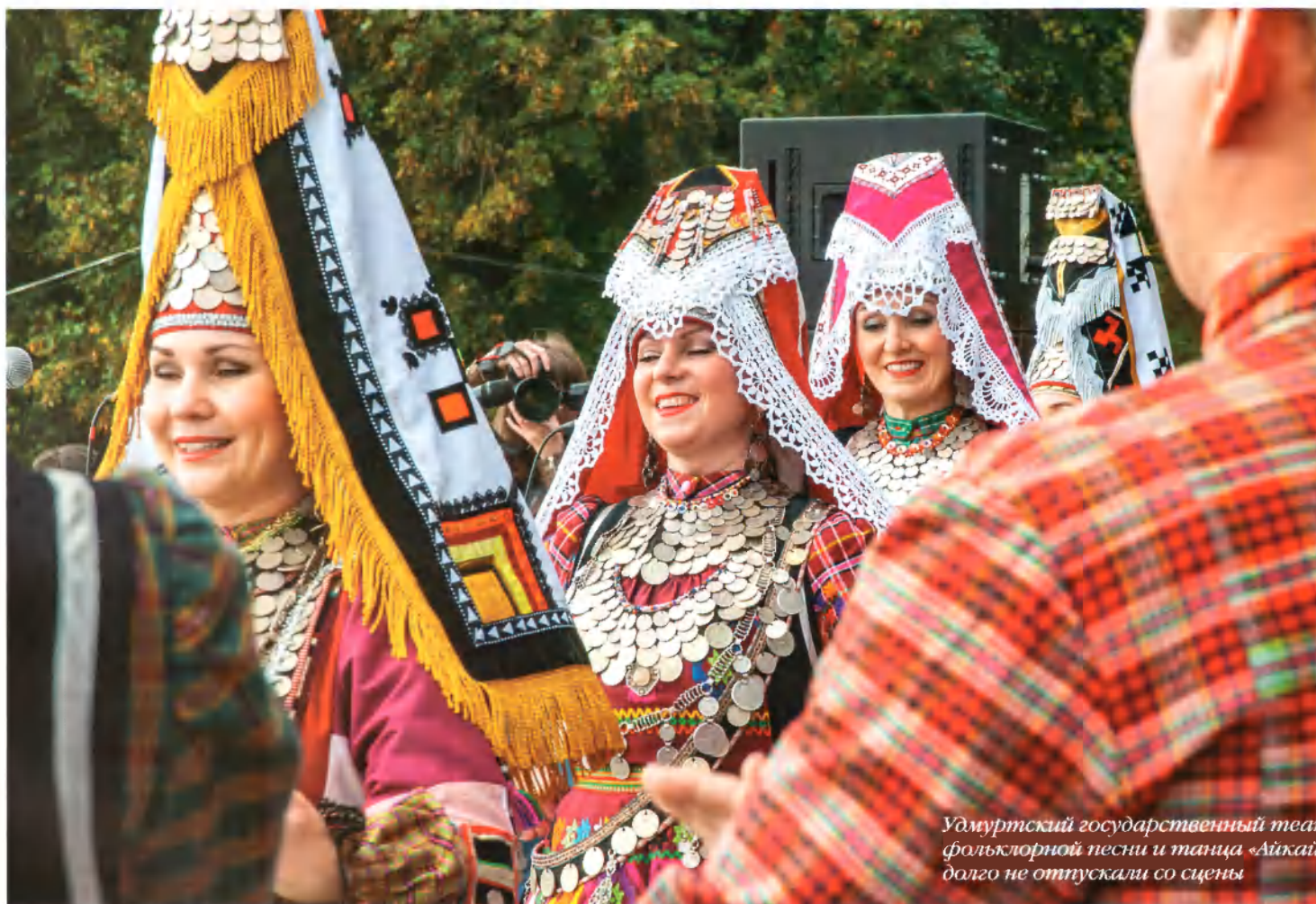
Удмуртский государственный театр фольклорной песни и танца «Айкай» долго не отпускали со сцены