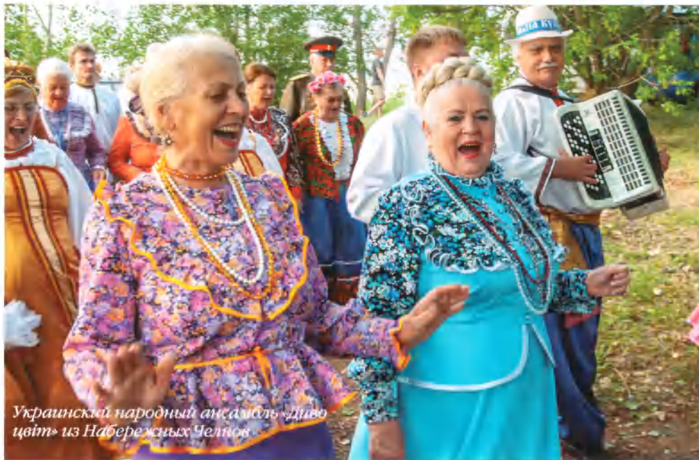
Украинский народный ансамбль «Диво цвіт» из Набережных Челнов

рады выступать на празднике Ивана Купалы, на который с каждым годом собирается все больше людей не только из Набережных Челнов, но и из Казани, Ижевска, Елабуги, Нижнекамска. Это праздник дружбы, мира!