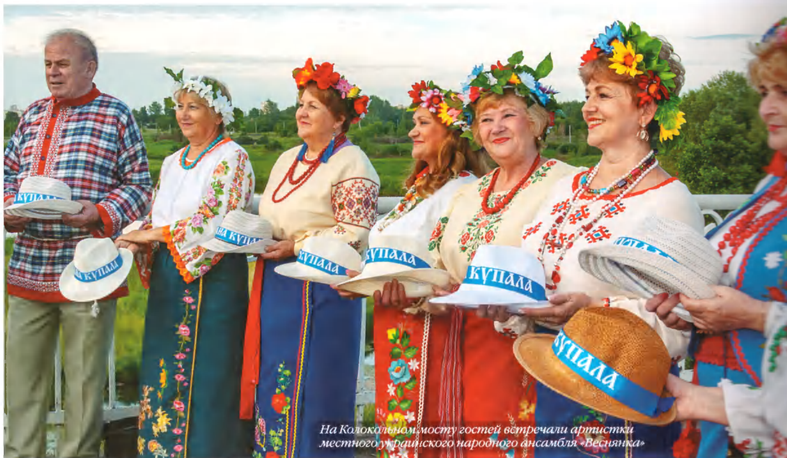
На Колокольном мосту гостей встречали артистки местного украинского народного ансамбля «Веснянка»

На Ивана Купалу украшают купальскую березу и прыгают через костер