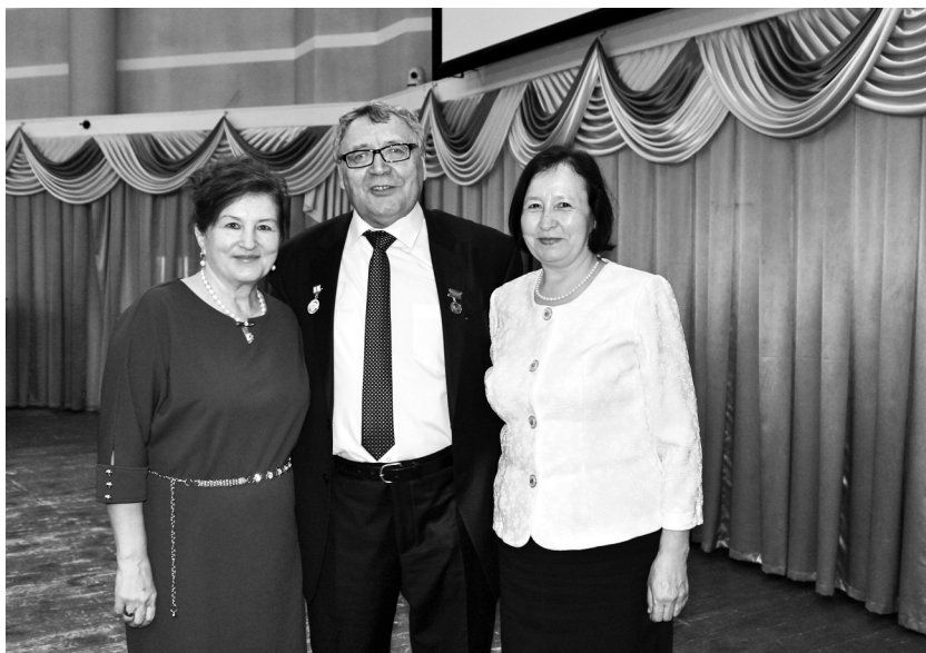
Остазыбыз халык шагыйре Рәдиф Гаташ юбилее кичәсеннән соң, Казан, 30 март 2016 ел