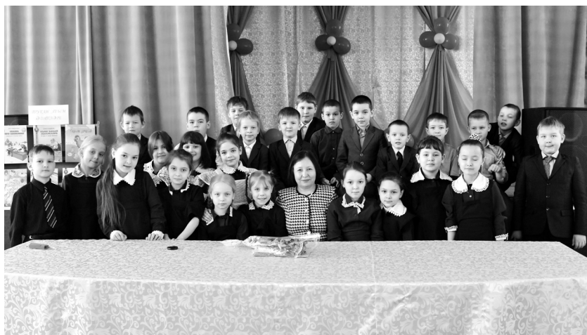
Шагыйрә 12 нче мәктәп укучылары янәшәсәндә. Яр Чаллы, 2016 ел, 11 март