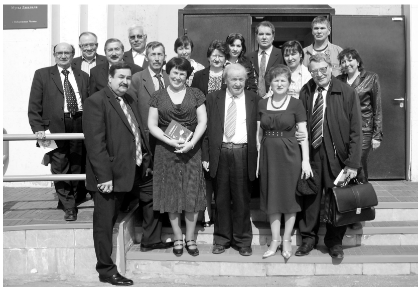
Казан кунаклары килгәч. Яр Чаллы Үзәк китапханәсендә