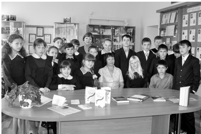
Знче мәктәп укучылары янәшәсендә. Яр Чаллы, 2012 ел