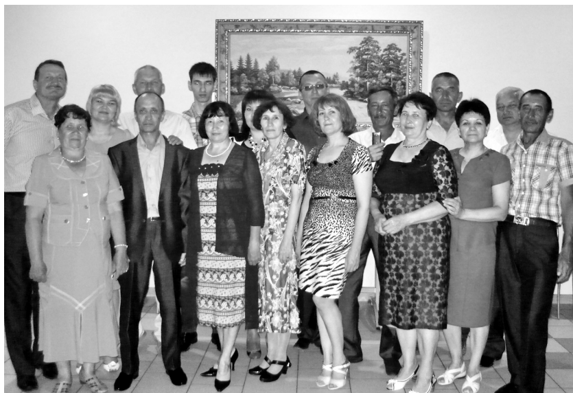
Туганнар бергэ жылгач. 2014 ел