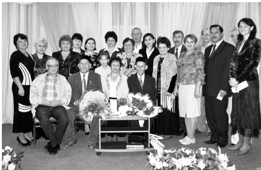
50 яшь тә тулды... Яр Чаллы, Үзәк китапханә, 2007 ел