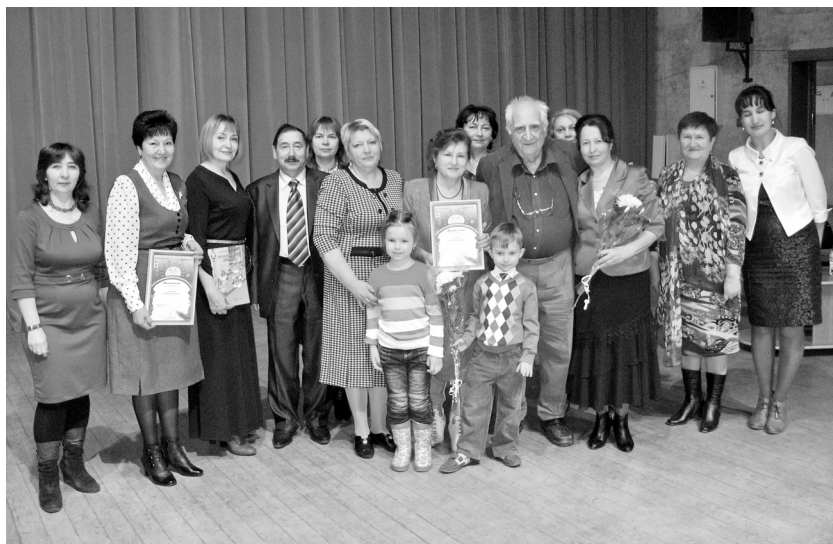
Мәскәу язучысы Александр Тимофеевский янәшәсендә. 2012 ел