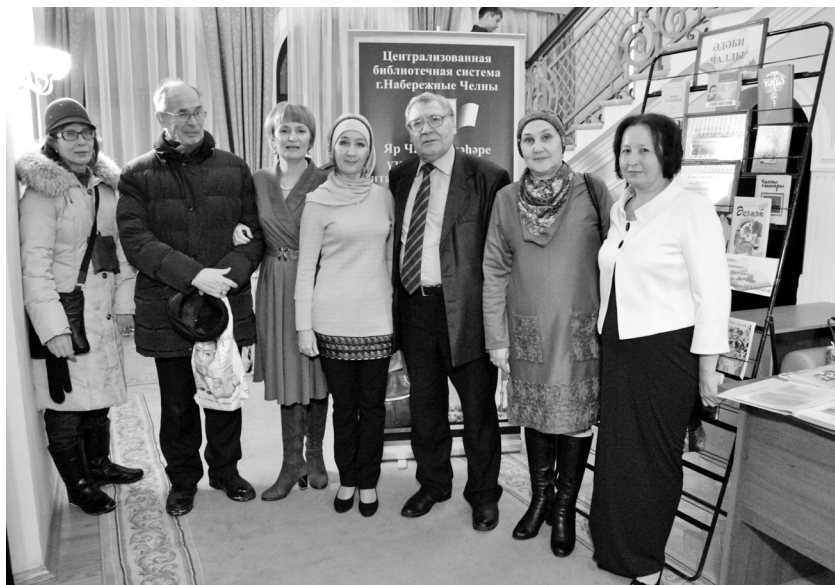
Чаллы язучылары Татарстан язучылар берлегендә очрашуда. Казан, 27 декабрь 2015 ел