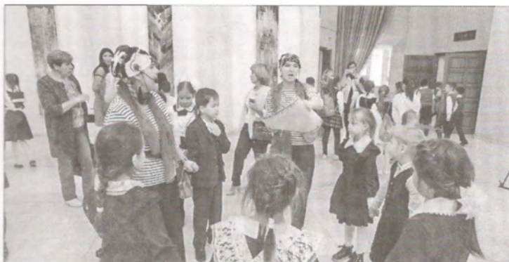
▲ На празднике, посвященном открытию проекта, ребят встретили пираты, но, в отличие от своих кровожадных собратьев, они обитают в книжных морях и весьма эрудированны

В Библиотеке-филиале № 8 Чистополя 3-го класса СОШ № 19 приняла участие в про-