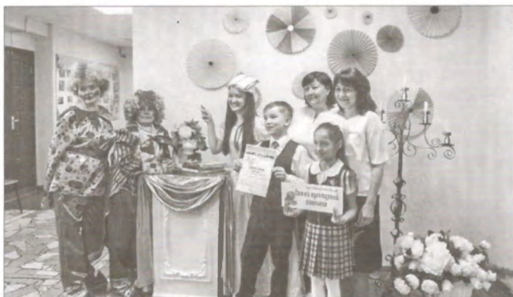
▲ Победителей чествовали дважды: первый раз – в ЦГБ, второй – в Органном зале