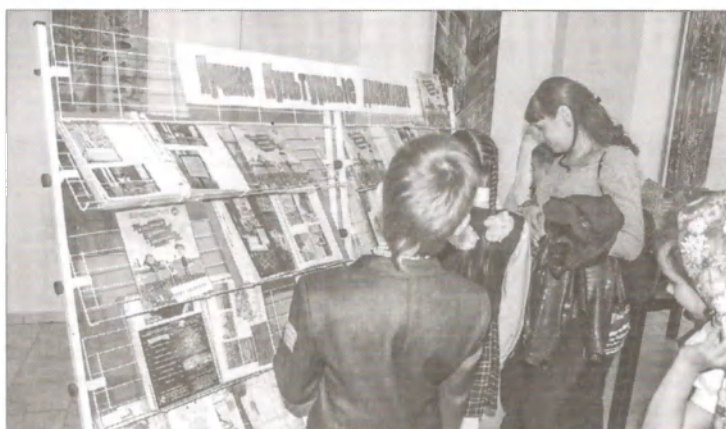
▲ Гости Центральной городской библиотеки знакомятся с лучшими работами. Будущим участникам они подскажут интересные идеи и вдохновят на креативные решения

приуроченную к Году экологии. Было представлено более 40 книг, журналов и брошюр на русском и татарском языках. Выставку дополнила инсталляция «Родник», созданная из поделок читателей. Во время мастер-классов дети с помощью канцелярских принадлежностей изготовили закладки «Вишенка» и ярких божьих коровок. Каждый аккуратно выполнял аппликацию, мобилизуя всю свою фантазию. Ребята совместно соорудили «Дерево дружбы», где на бумажных ладошках написали свои имена и тёплые пожелания окружающим.