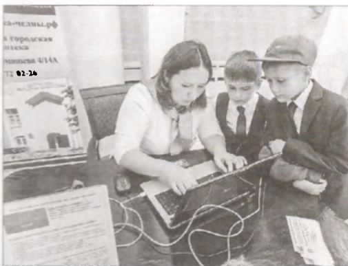
◀ Здесь же можно было оформить электронный читательский билет, отразив это важное событие на первой странице дневника

грамме «Моя малая родина». Они посетили 14 мероприятий. Класс был награжден специальным дипломом «Самая активная команда».