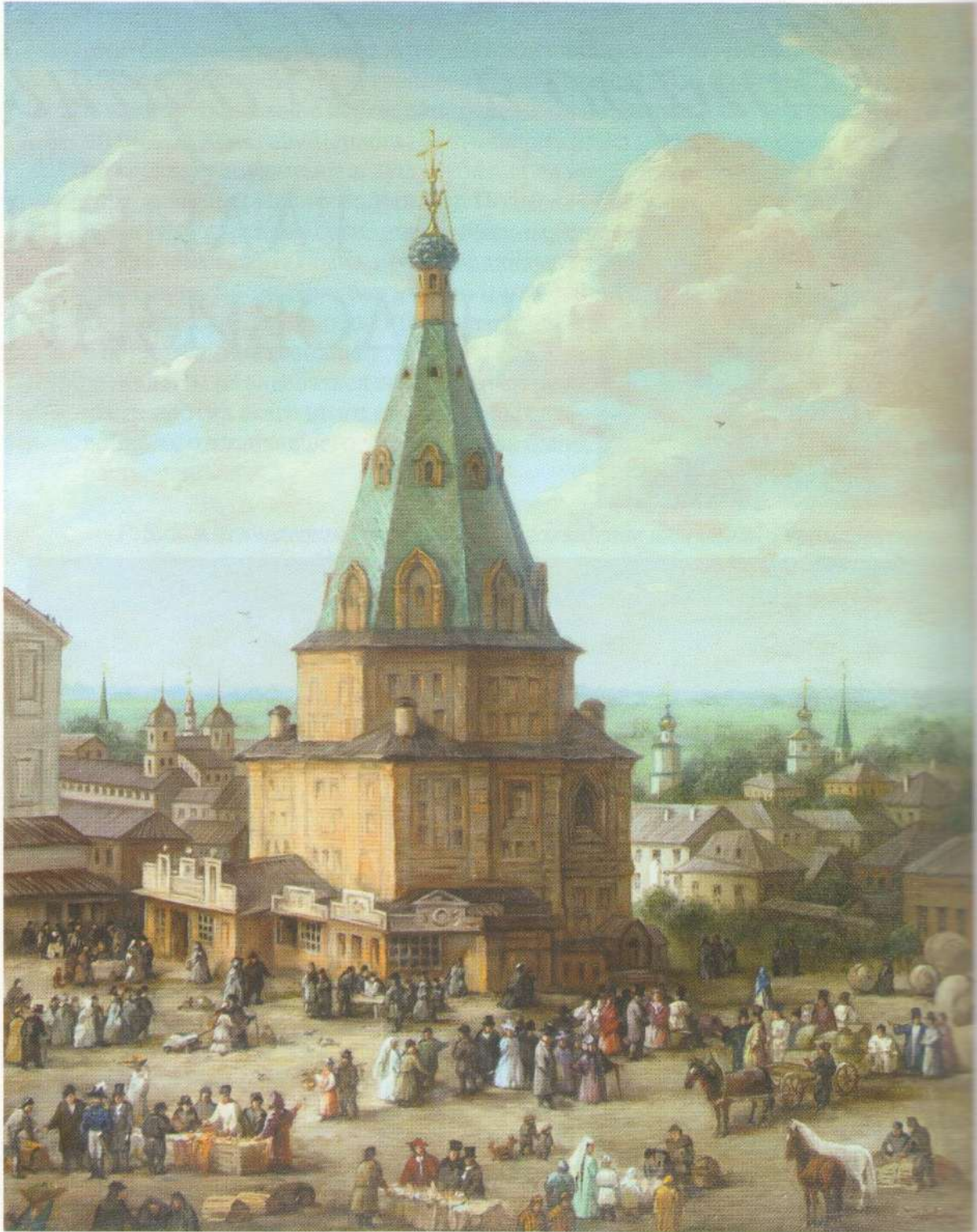
Артамак Д.И. Башня на торговой площади в Казани, XIX век. Х., м.. 90×70. 2008 г.