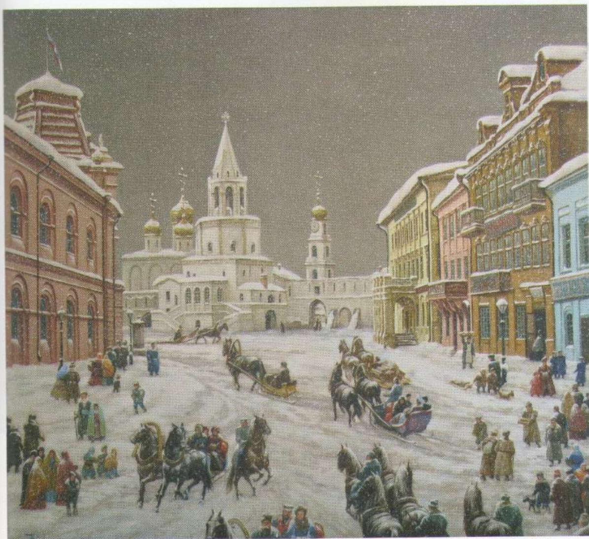
Вид на Спаскую башню со стороны Воскресенской улицы, XIX век. Х., м., 100×110. 2010 г.