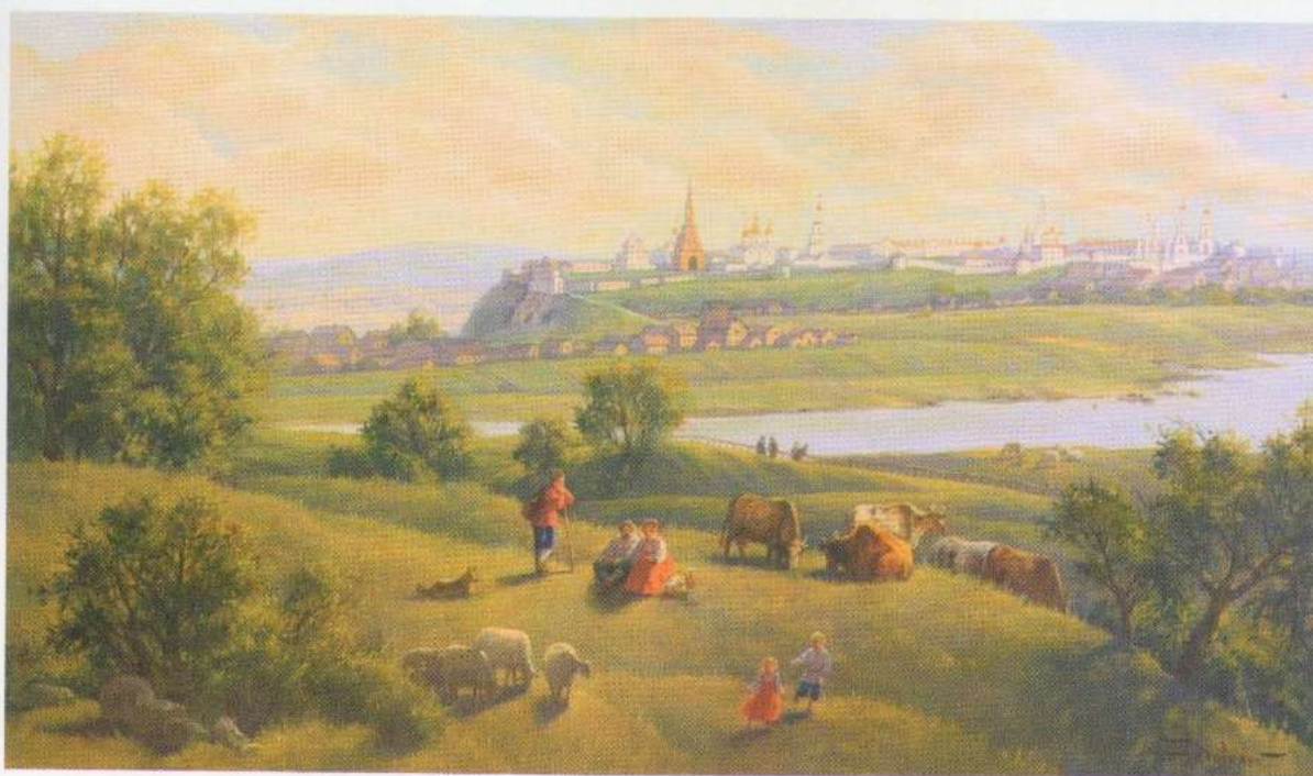
Панорама Казанского кремля со стороны реки Казанки, XIX век. Х., м.. 110×65. 2009 г.