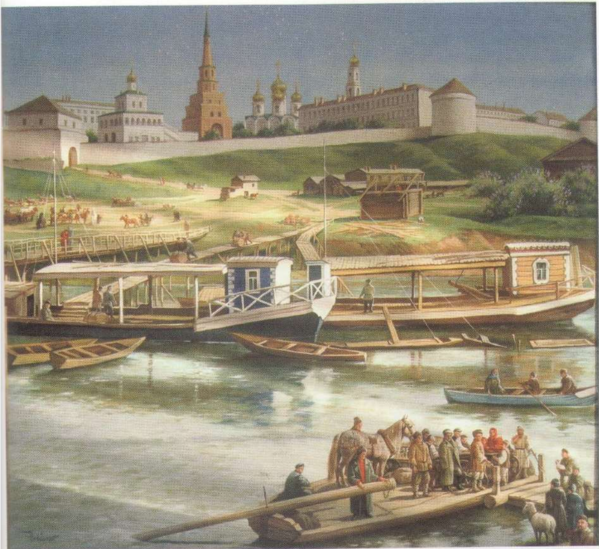
Весенний разлив на Казанке, XIX век. Х., м., 100×110. 2010 г.