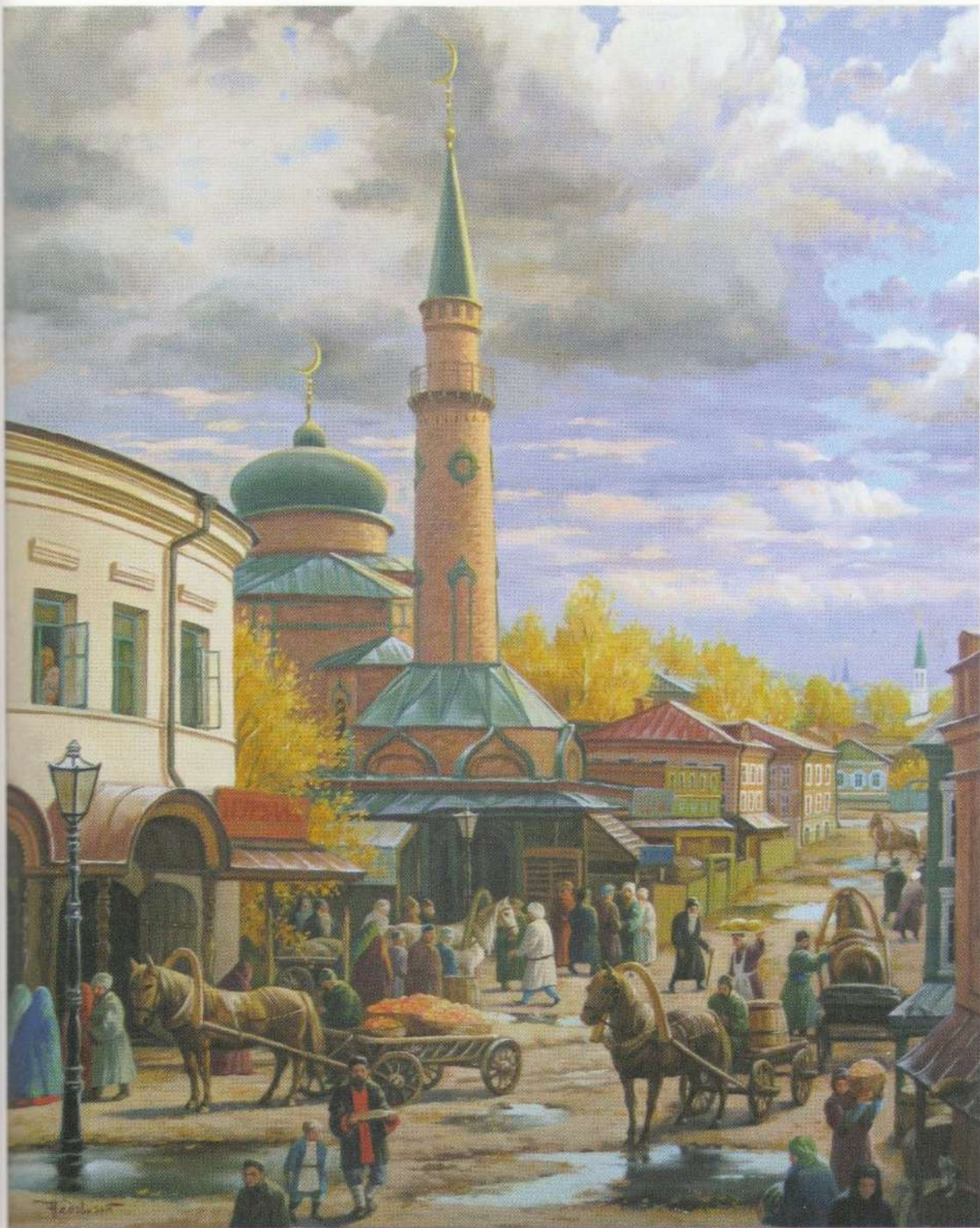
Старотатарская слобода в Казани (Юнусовская мечеть), XIX век. Х., м., 100×80. 2010 г.