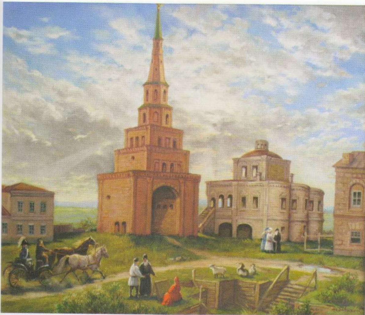
Башня Сююмбике, XIX век. Х., м.. 50×60. 2008 г.