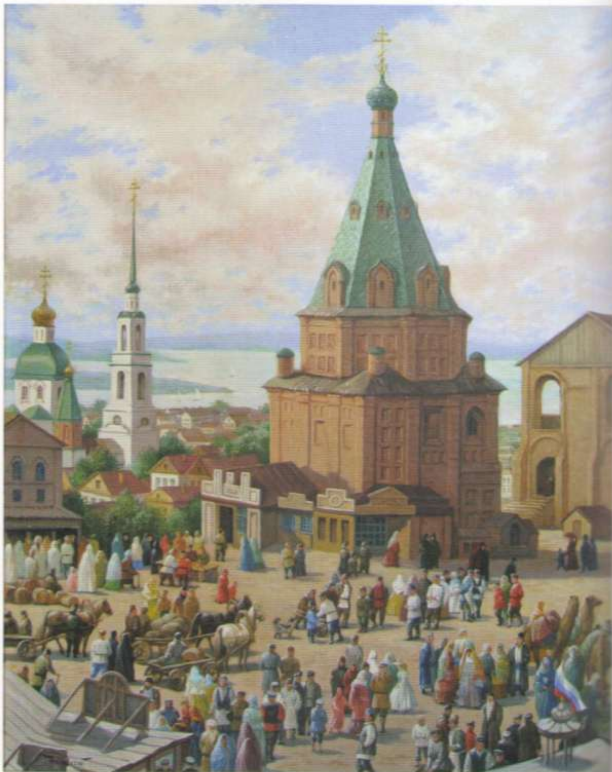
Храм Святителя Николая на торговой площади в Казани, XIX век. Х.,м., 100×80. 2010 г.