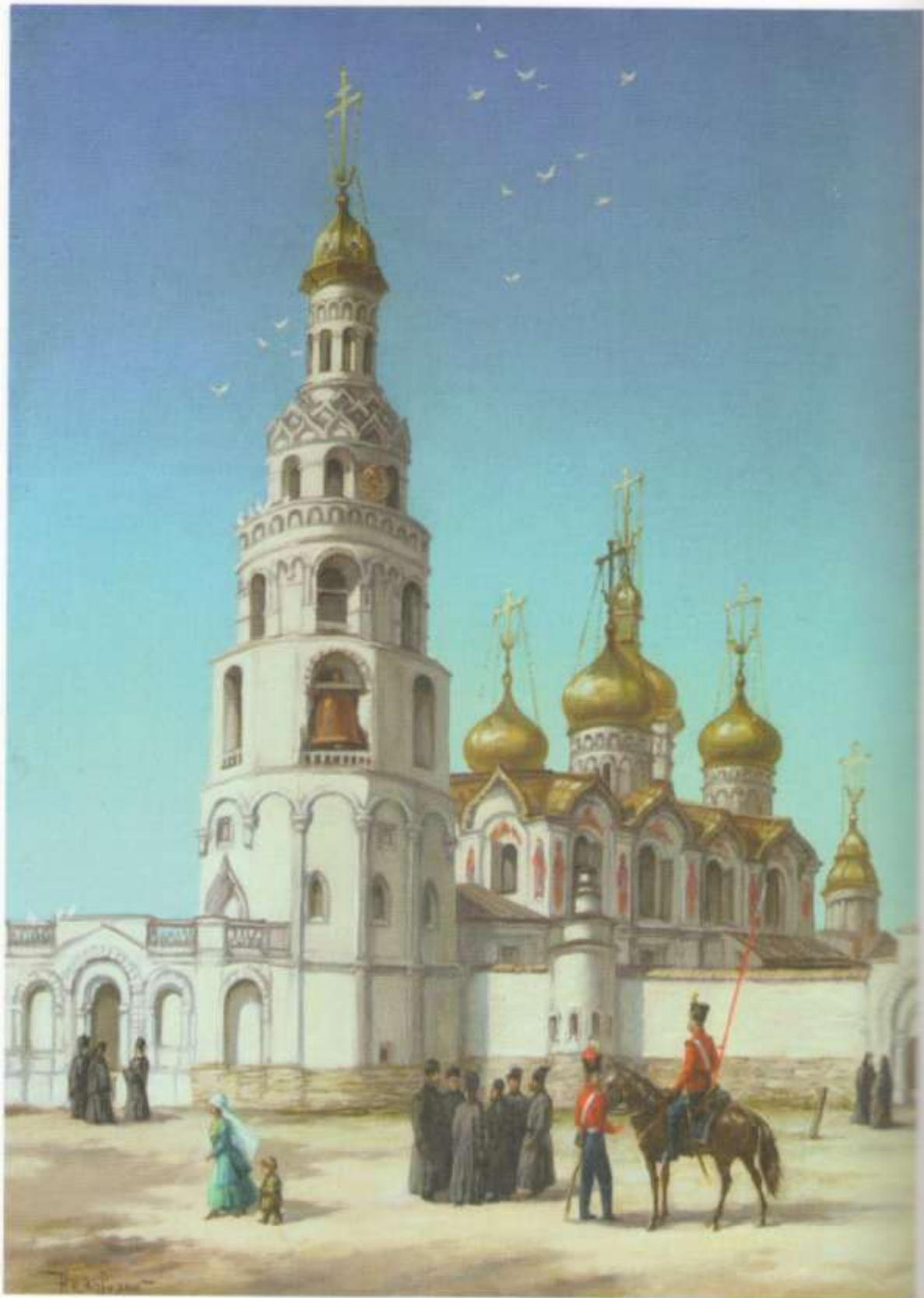
Благовещенский собор в Казани, XIX век. Х., м., 70×50. 2008 г.