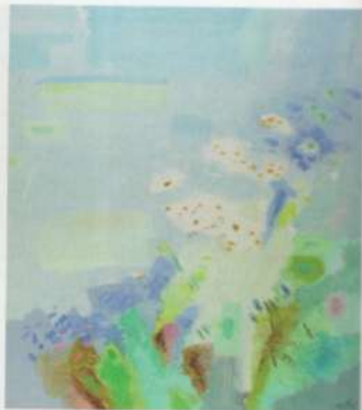
«Июль» х. м. 80х90 2006 г.