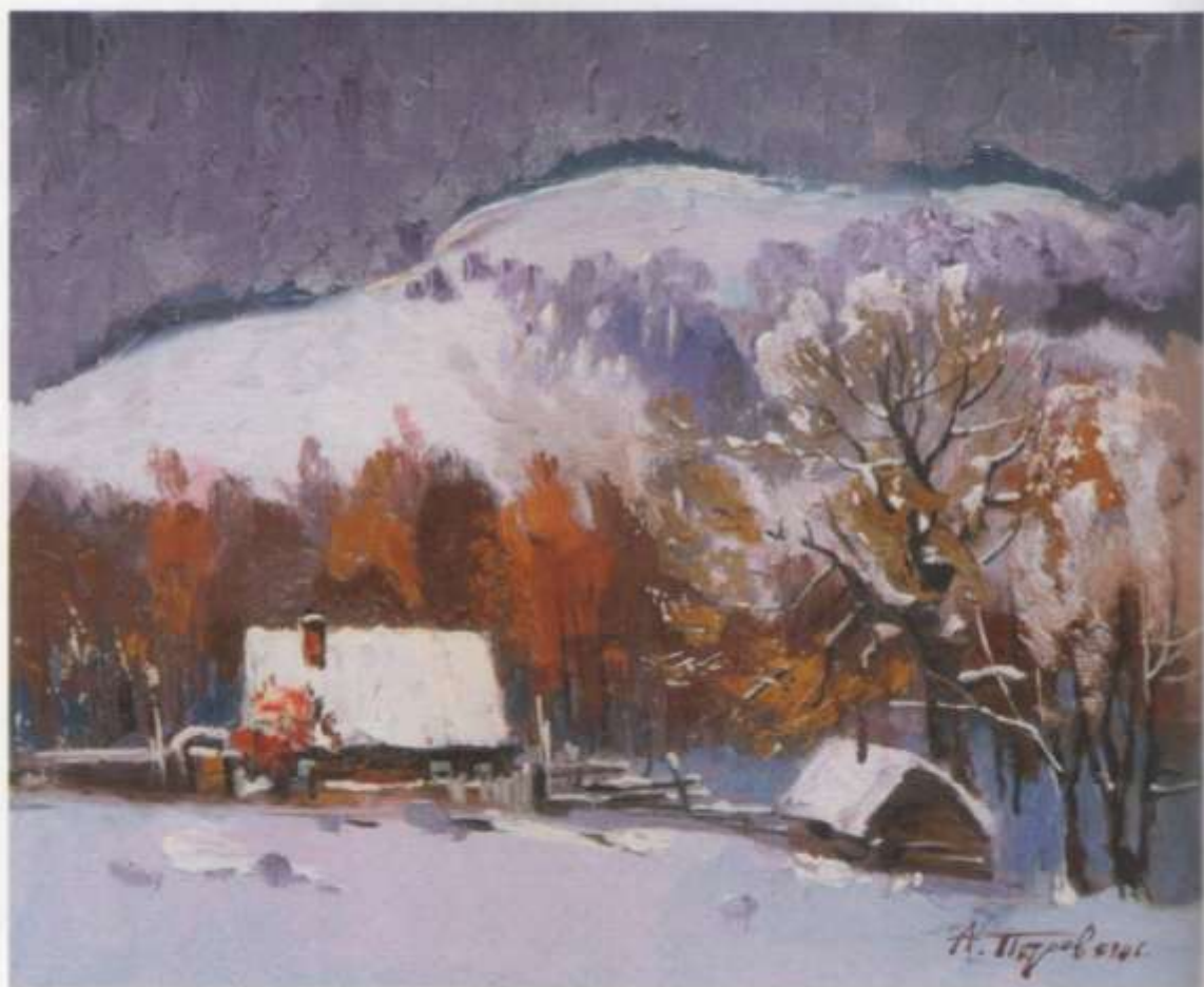
«Деревня Ямаш» орт. м. 33x37 2010 г.