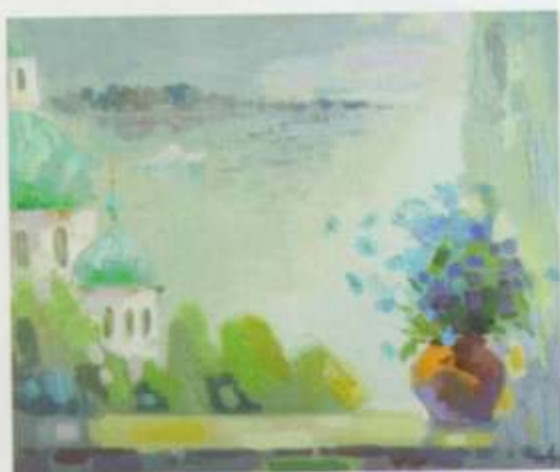
«Июнь» х. м. 70x80 2007 г.