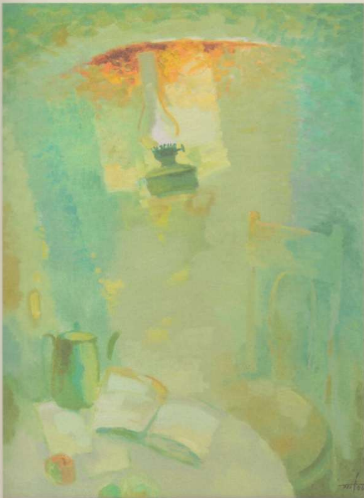
А. Петров. «Окно поэта» х. м. 60x80. 2006 г.