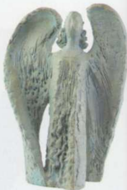
«Ангел хранитель» тон, шамот 29x18x9 2009 г.