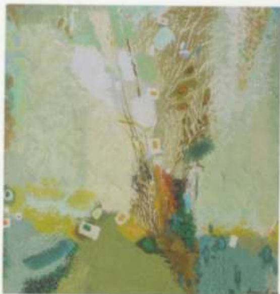
«Лето» акр. 80х95 2010 г.