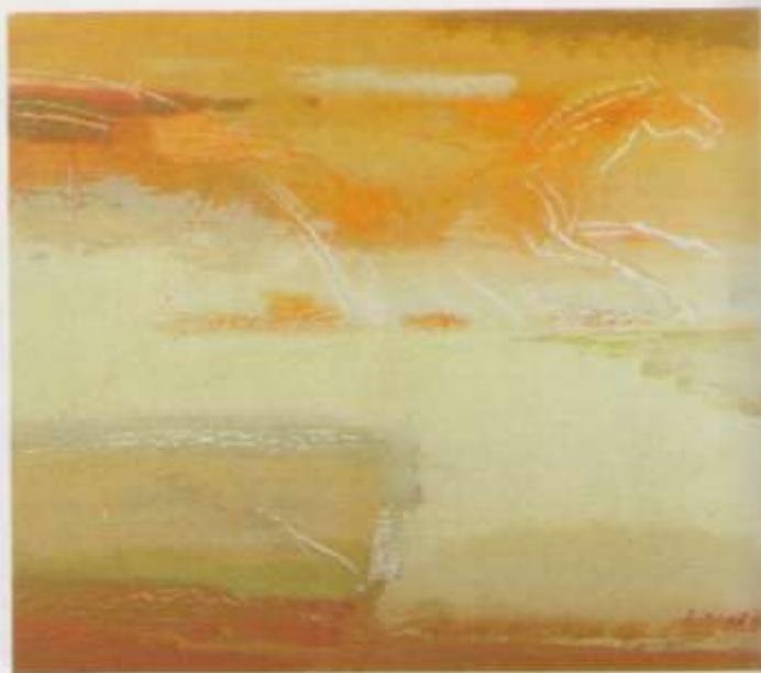
«Бег» х. акр. 70x80 2009 г.