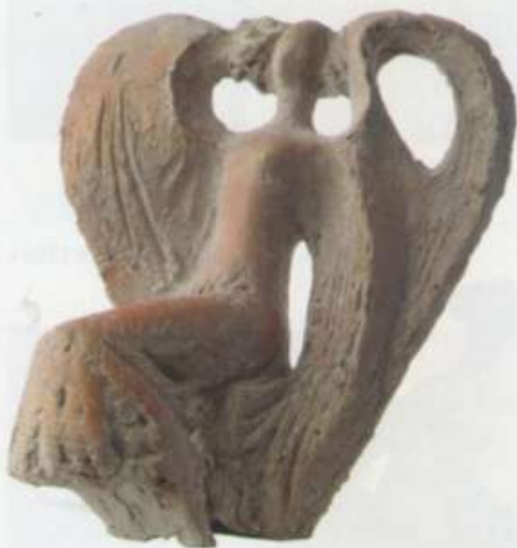
«Сердце ангела» тон, шамот 32x25x17 2010 г.