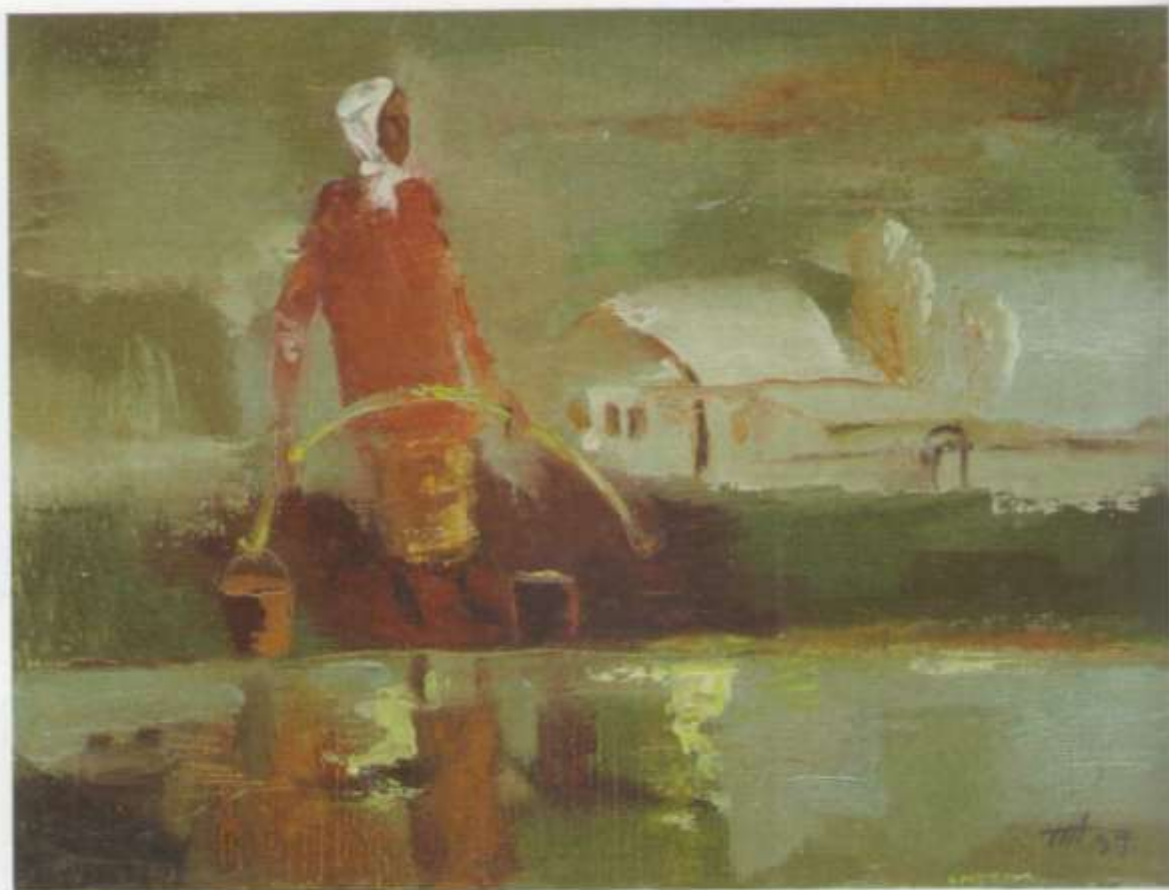
«У реки» х. м. 30 х 40 1999 г.