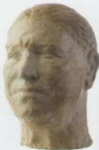
Портрет матери тон, гилс 33x25x27 1986 г.