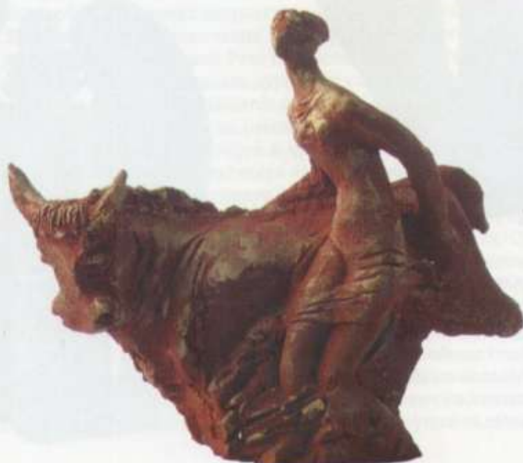
«Композиция» (из серии «Похищение Европы») тон. шамот 27x10x32 2010 г.