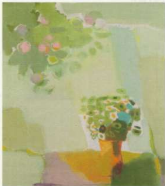
«Июль» х. м. 65x75 2010 г.