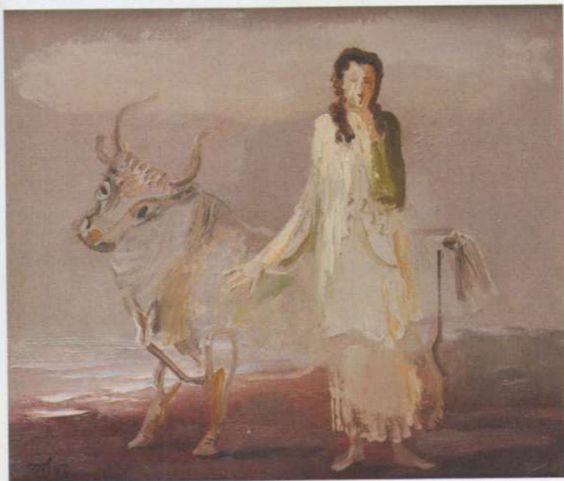
«Европа сомневающаяся» х. м. 33x38 1996 г.