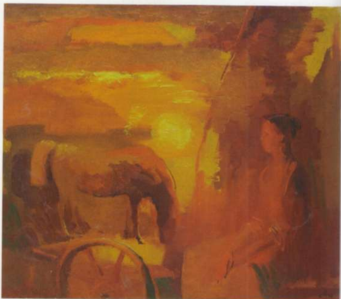
«Горячий вечер» х. м. 65х75 1998 г.