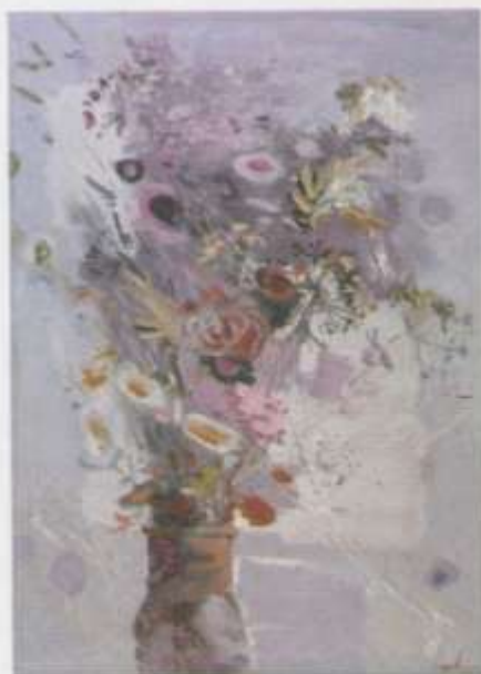
«Натюрморт зимний» х. м. 50x70 2002 г.