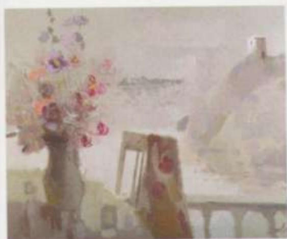
«Сумерки» х. акр. 70x80 2007 г.