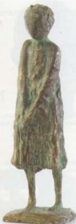
«Этюд» тон. гипс 20x5x4 1986 г.