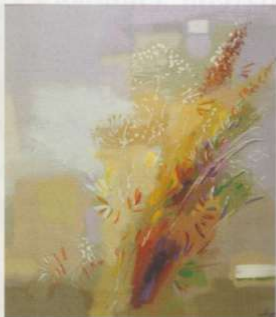
«Сентябрь» х. м. 65x75 2006 г.