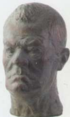
Портрет отца тон, гилс 35x27x29 1987 г.