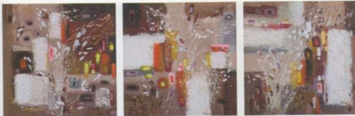
Триптих «Предчувствие Нового года» к. акр. 3x60x60 2007 г.